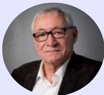
Directeur de la publication : Emile BUCH